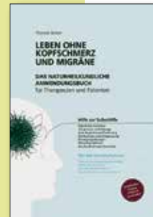
Das naturheilkundliche Anwendungsbuch für Patienten und Therapeuten – Hilfe zur Selbsthilfe

Für Therapeuten zusätzlich: Akupunkturkonzepte (Kopfschmerz, Migräne, Clusterkopfschmerz, Trigeminusneuralgie u.a.), Neuraltherapie, Manuelle Therapie, Lymphdrainage, Irisdiagnose u.a.m.