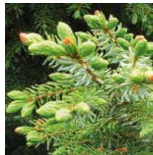
Zum Titelbild: Fichtensprosse Das Hauptanwendungsgebiet der Fichte sind Erkrankungen der Atemwege, vor allem wenn sie bakterieller Natur sind und Schleim festsitzt. Der Fichtennadel-Tee hilft aufgrund seines hohen Vitamin-C-Gehaltes auch gegen Frühjahrsmüdigkeit und andere Vitamin-C-Mangel-Erscheinungen. (Aus „heilkraeuter.de“)

Die gentechnisch hergestellten, immer besser auf den Patienten zugeschnittenen Hightech- aber auch Hochpreis-Medikamente suggerieren zwar, daß die Medizin früher oder später alle Krankheiten individuell behandeln wird. In seinem Vortrag mit vielen Tipps aus der Praxis geht es dem Referenten jedoch darum, die traditionell verwendeten Heilpflanzen und -mittel aus der Schmutzdecke der Medizin herauszuholen und ihr Potenzial für eine effektive und schonende Therapie sichtbar zu machen.