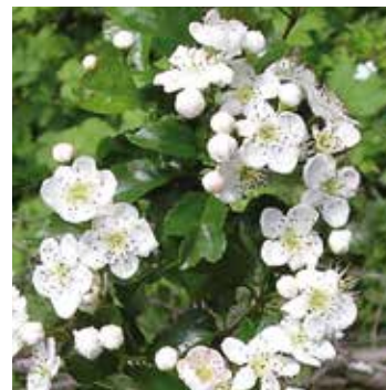
Zum Titelbild: Weißdornblüten Arzneipflanze des Jahres 2019

Diese spannende Thema wird von Wolfgang Spiller lebendig und praxisnah vermittelt.