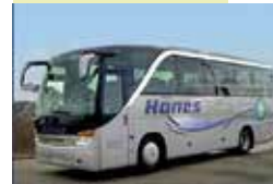
(der Freitag ist ein sog. Brückentag nach Himmelfahrt)

Reisepreis für die Busfahrt, Weleda- Führung und Gartenschau: Gäste 45,- € Mitgl. 40,- € (kann in bar auf der Hinfahrt ent- richtet werden)